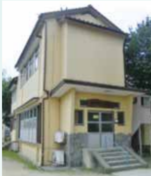
活動拠点 梶田第五区民館

また、榿は見栄えのする樹姿などから街路樹としても親しまれています。世に榿木と言われるゆえんでしよう。この榿の字を戴く梶田は榿木にあやかっつて少しばかり誇らしい気持ちです。