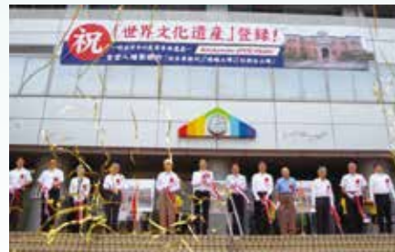
テープカット・祝賀横断幕除幕の様子

現在、15町会、約1,500世帯数。年々高齢化が進んでいます。 地域の特徴としては、住宅が大半を占め、商店が少なくまち全体のにぎわいに欠けることは否めません。このような中、高齢者対策として、30数年続いている『ラジオ体操』や梶田小学校全児童と共同で『梶田川や公園・道路の清掃』をしています。 また地域活動として、数十年続いている『茶屋町祇園山笠』と『どんと焼き』を今後も継続していくとともに、梶田市民センターの行事や防災・防犯パトロール等により、安全安心なまちづくりに努め、さらに、隣接自治区会とともに様々な事業を進め、榿にはじまないように前進して参ります。 (梶田第五 亀田和實)