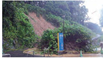
高炉台公園で発生した崖崩れ 7月7日

中でも八幡東区では、7月7日から10日にかけて250ミリという市内で最も激しい降雨にみまわれたため、