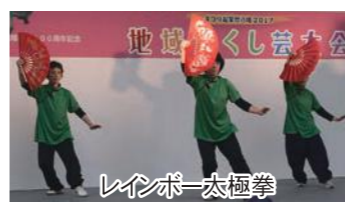
レインボー太極拳

尾田第一自治会推薦の「森ん子の会」の文化箏・大正琴演奏。八幡大谷まちづくり協議会推薦の「レイン