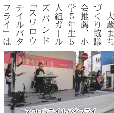
スワロウテイルバタフライ

尾田第一自治会推薦の「森ん子の会」の文化箏・大正琴演奏。八幡大谷まちづくり協議会推薦の「レイン