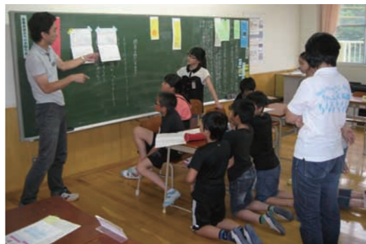
企画委員会での話し合い

大蔵の自然とまちが大好きな児童たちが心を込め作ったもので、まち中に「あいさつ」「えがお」「げんき」があふれ