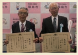
左から野依会長、伊藤会長