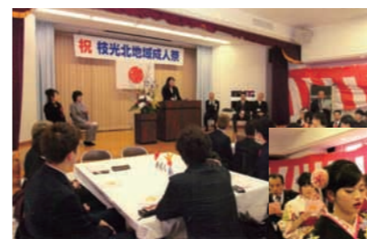
写真は平成29年度の様子

その後、当地域の新成人を対象とした「地域成人祭」となり、現在、主催は枝光北まぢづくり協議会で主管は青少年育成会が行なっています。