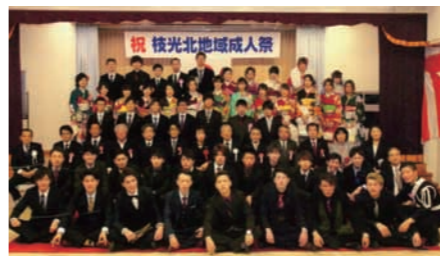
写真は平成29年度の様子(参加者 約60名)

平成30年度、枝光北成人祭は平成31年1月13日(日)、枝光北市民センター多目的ホールで開催されました。この成人祭は、昭和39年に当市民センターが公民館として開館された同時期に「青少年育成会」が設立され、その青年部が有志に呼びかけて、翌昭和40年1月に「20歳の同窓会」として開催したのがスタートです。