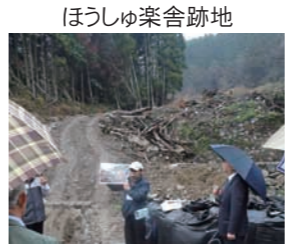
ほうしゅ楽舎跡地 巨岩が砂防ダムを破壊して下流の建物を倒壊させた現場や橋に大量の流木が押し寄せ河川氾濫が起きた現場で、被害状況を詳しく聞くことができました。

一昨年、昨年と2年連続で、八幡東区でも豪雨による大きな被害が発生しました。このような災害発生時にどのように対応するかを考えるため、今回の当連合会の視察研修では、一昨年7月の九州北部豪雨で特に甚大な被害を被った東峰村を中心とした視察を行うことにし、昨年12月6日・7日両日に実施しました。